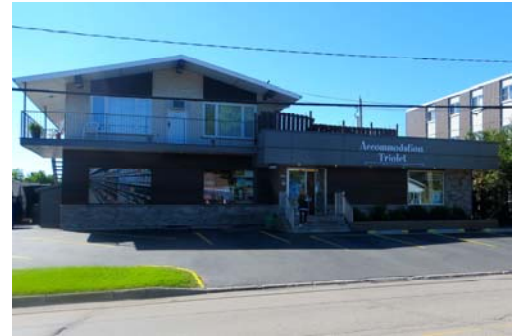
Une façade moderne et accueillante.

Le couple Langlois-Leblanc conclut en disant : « Toutes nos actions sont faites pour les clients ».