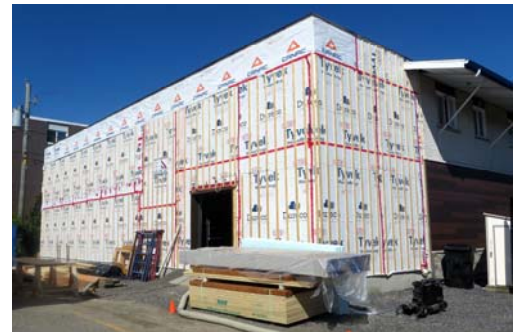
La majorité de l'agrandissement réalisé cette année va permettre de doubler la superficie de la chambre froide.